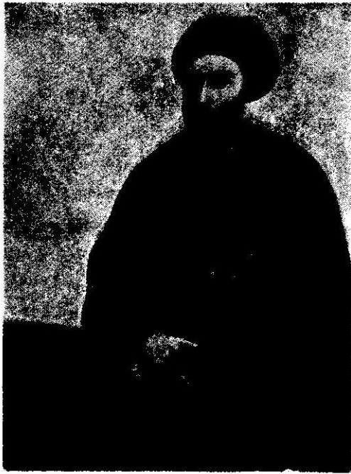
تصویری از سید علی محمد باب که بایمان آنرا نسبتاً اصیل و بسیار شبیه به سید علی محمد باب می دانند